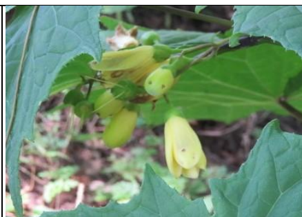
キレンゲショウマ