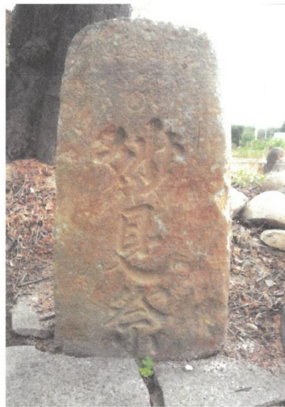
妙見祭 弘化二巳年十一月廿二日 上部に星(北斗七星か)が彫られている