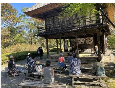
「民家園ふれあいまつり」